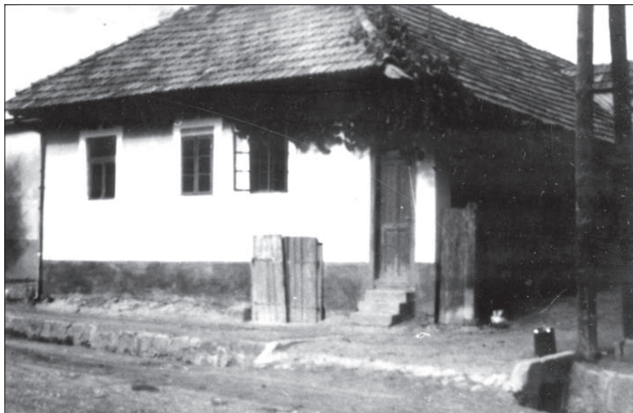
Budova v Horných Žemberovciach, v ktorej sídlilo úverné družstvo.