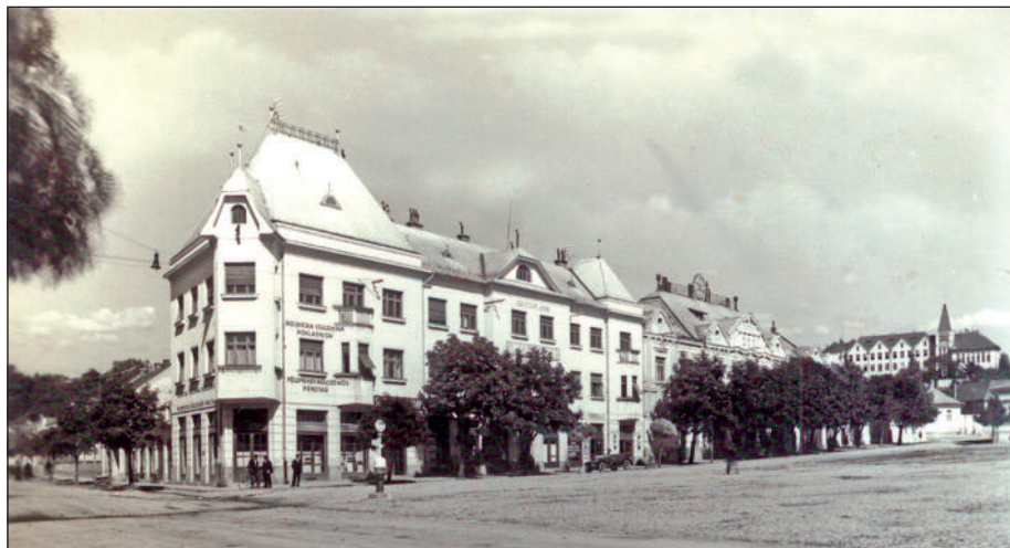
Jozefčekov dom, sídlo Roľníckej vzájomnej pokladnice v Leviciach.

V októbri roku 1924 vznikol Zväz roľníckych vzájomných pokladníc, ako riadiaca inštitúcia úverových družstiev pod názvom Roľnícke vzájomné pokladnice (ďalej RVP). V prvých rokoch svojho účinkovania sa zväz zameriaval prevažne na zakladanie RVP, organizovanie ich činností, kontrolu hospodárenia a správu týchto finančných ústavov. Roľnícka vzájomná pokladnica v Leviciach vznikla na ustanovujúcom valnom zhromaždení 31. októbra 1925. Bankovú činnosť začala od 1. januára 1926. Od roku 1929 po dokončení nového Jozefčekovho domu na námestí sa pokladnica presťahovala do prízemja tejto novostavby.