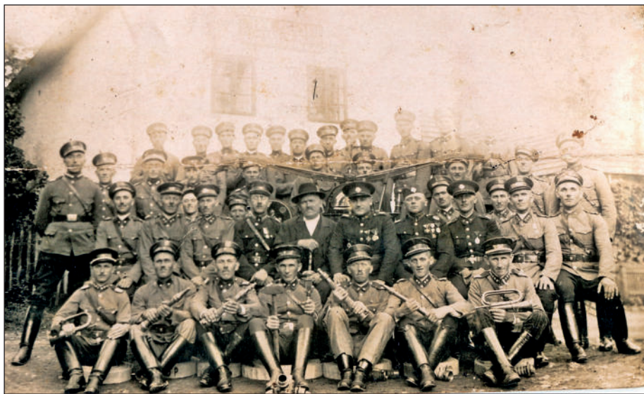
Prandorfskí hasiči pred budovou úverného družstva.