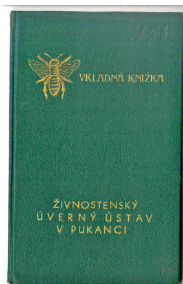
Vkladná knižka Živnostenskej záložne.

V roku 1926 Ústredné družstvo vo svojej správe uviedlo, že mnohé z novozaložených družstiev sa stali za krátku dobu svojho pôsobenia dôležitými hospodárskymi činiteľmi. V tom čase existovalo na Slovensku 500 úverných družstiev.