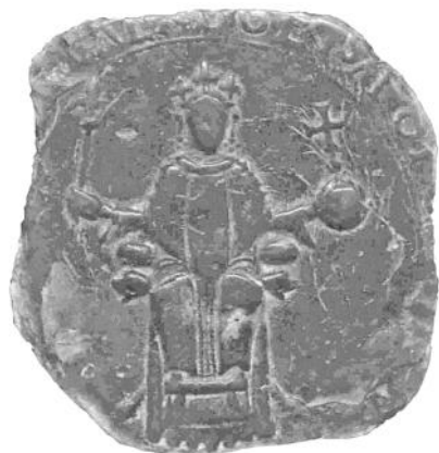
Pečať listiny z r. 1158

Problematické sú však z hľadiska tejto listiny Levice, o ktorých časť autorov tvrdí, že ide o stredovekú dedinu Staré Levice (O Leva, Óléva), ktorá sa však pod týmto názvom spomína až v roku 1388. Staré Levice zanikli počas tureckých vojen v r.1615. Ich pamiatka sa dodnes zachovala v názve dvoch viničných honov, Dolných a Horných Starých Levíc (Alsó Óléva, Felső Óléva), na juhovýchodnom okraji intravilánu mesta. Stredoveká dedina bola doložená viacerými nálezmi pri výstavbe rodinných domov v časti mesta Cigánka (dnešné ulice Narcisová, Východná,