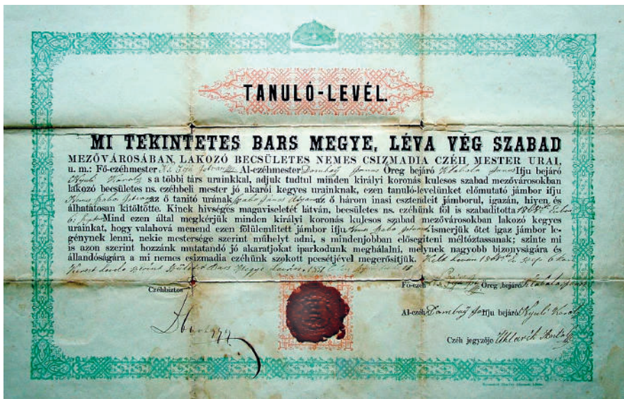
Výučný list čizvárskeho cechu, vytlačený v roku 1865, použitý v roku 1868