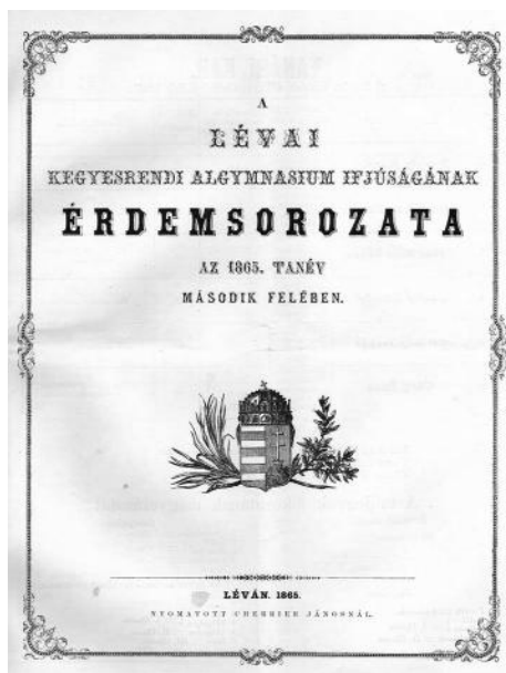
Titulná strana výročnej správa Gymnázia v Leviciach 1865 tlač J. Cherrier