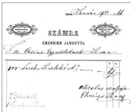
Účet za tlačiarске práce pre Levické kasíno z roku 1866