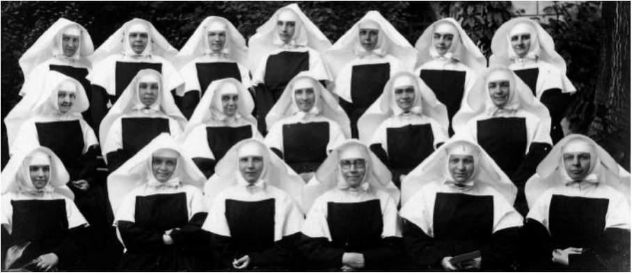
Sestričky v medzivojnovom období