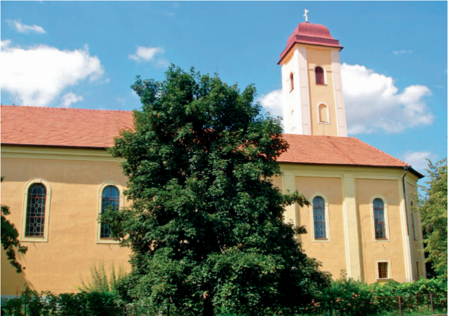
Kláštorný areál s kostolom sv. Jozefa