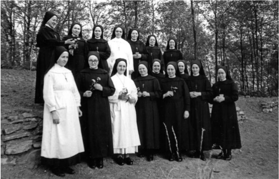
Milosrdné sestry sv. Kríža v Krškanoch v roku 1965

Levíc, ich vystriedali sestry z Maďarska, po roku 1945 opäť v nemocnici slúžili slovenské sestry. Táto kongregácia patrila k najväčším ženským rehoľným spoločenstvám na Slovensku a čo do počtu, bola najväčšou kongregáciou pôsobiacou v Leviciach. Kongregácia bola založená v roku 1852 vo Švajčiarsku podľa regule sv. Františka Assiského na ochranu chorých a sirôt. V roku 1927 bola vytvorená slovenská provincia so sídlom v Podunajských Biskupiciach. Vzdelanie sestier bolo zabezpečené v dvojročnej ošetrovateľskej škole v Bratislave. Sestry v Leviciach pracovali a žili v priestoroch nemocnice, a preto nepodliehali sústreďeniu. 16 V roku 1950 pracovalo v nemocnici 41 sestier. Pracovali ako inštrumentárky na operačných sálach, röntgenologičky, ošetrovateľky, zabezpečovali chod kuchyne, práčovne, pracovali v krajčírskej dielni, nebolo možné ich v priebehu jedného dňa nahradiť.