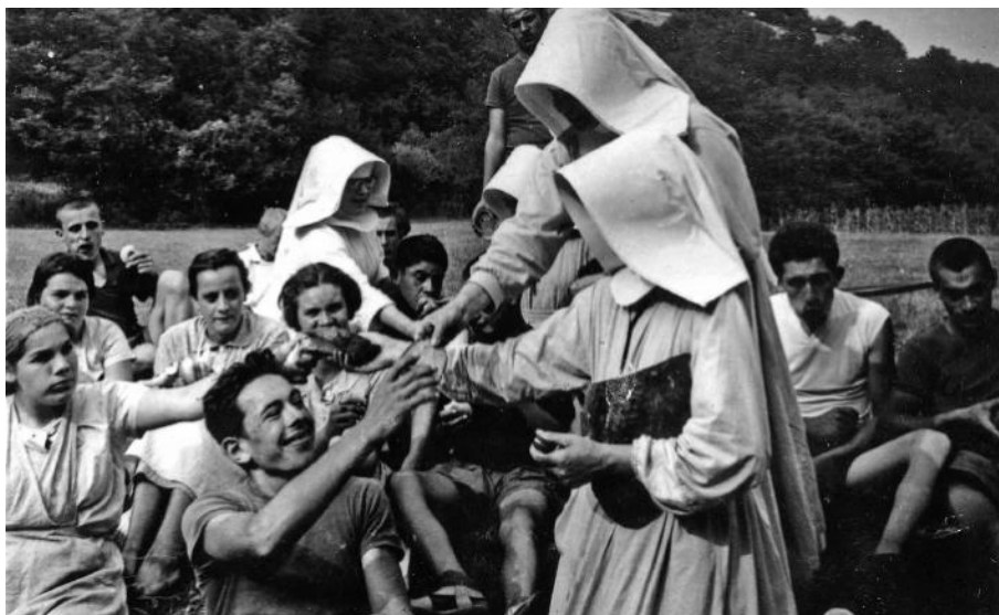
S chovancami v Krškanoch

Preto bolo rozhodnuté, že budú postupne vystriedané civilnými zamestnancami. Aby nevplývali na pacientov, bolo nutné zamedziť ich styku s chorými a s ostatnými sestrami, preto bolo šesť sestier v roku 1953 preložených do Ústavu sociálnej starostlivosti v Krškanoch, tu sa starali o mentálne a telesne postihnutých, na tomto mieste sa zdali režimu menej nebezpečné. V Krškanoch pôsobili sestry do 1985, v levickej nemocnici do roku 1959.